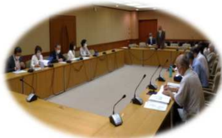
名張市立病院を守りよくする会との懇談会