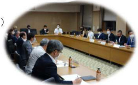
名張商工会議所青年部との意見交換会