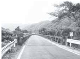
県道上笠間八幡名張線 (薦原橋付近)

Q 上笠間八幡名張線は 伊賀南部浄化センターは、平成12年3月31日に伊賀南部環境衛生組合と薦原地区区長会とで協定書を締結した。操業期間は12年度から26年度までの15年間とし、薦原地区内公共事業推進計画書が市長より提出された。現在、主な残事業は県道上笠間八幡名張線である。早期の完成を望むがいかがか。