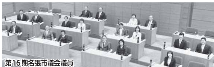
第16期名張市議会議員