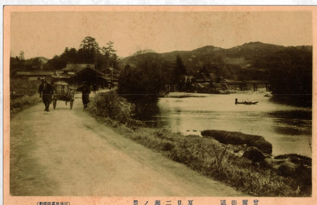
「川地寫真館撮影」の絵葉書（研究室所蔵）