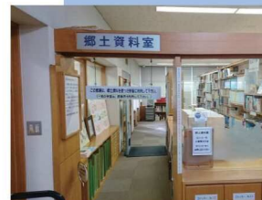
図書館にある郷土資料室