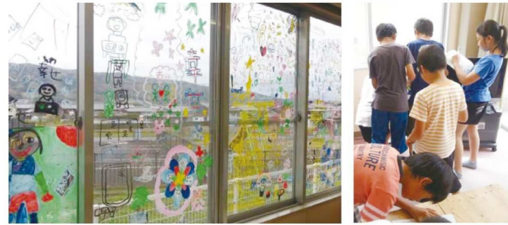
一ノ井児童館での活動の様子

一ノ井市民センターでは、児童館や教育集会所で、保育園児や小中学生が、差別やいじめを見抜き、なくすための活動をしています。児童館を訪問すると、館内ウォークラリーをしながら人権について学ぶことができます。児童館の窓には、子ども会活動の一つとして取り組んだ心温まるメッセージが、一面に描かれています。また、館内には、子ども会が取り組んだ作品が展示されていたり、キャラクターを探すゲームがあったりします。