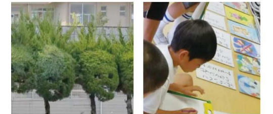
比奈知文化センターの植木 比奈知文化センターでの「人権カルタ」の学習

子どもたちの学習に寄りそってきた職員は、仲間づくりや人権尊重への願いを次のように話しました。