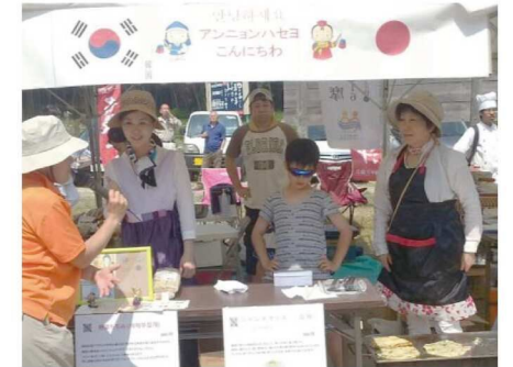
地域の催し「世界の屋台村」の様子

名張市内に住む外国人は2022（令和4）年5月1日現在で1049人です。名張市人権センターでは毎年、市民との交流の集いやイベントを開催しています。多文化共生社会の実現に向けて地域での催しで「世界の屋台村」も実施しました。ブラジルやペルー、タンザニア、インドネシア、中国、韓国、タイなど世界各国の料理を販売し、食文化の違いを楽しみながら、市民との交流イベントを開催することも増えてきました。