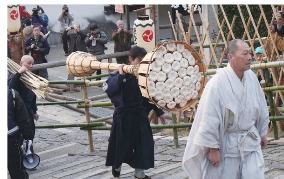
一ノ井の松明が使われる達陀松明

運ばれた松明木は東大寺の蔵で1年間乾燥させ、翌年の「達陀」行法などで使われます。「達陀」は、修二会のクライマックスと呼ばれ、3月12・13・14日の最後の3日間深夜に二月堂の中で行われます。その時に使われる「達陀松明」(長さ約3m、重さ40kg)に火を付け、炎の燃え盛る松明を練行衆が、堂内の観音様の周りを火のついたまま引きずり回し、最後に床に叩き付けます。これは、人々の煩惱や穢れを全て焼き尽くし、二月堂内を清めるという神聖な儀式です。この松明の芯木として一ノ井の木が使われています。