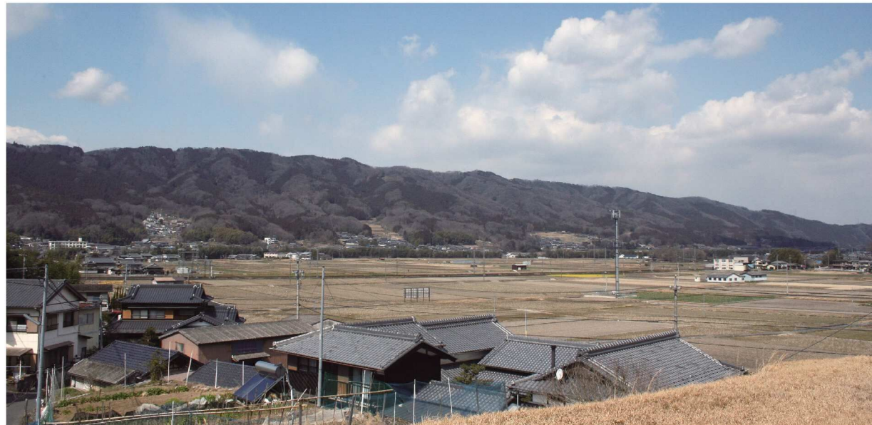
矢川から黒田方面を望む

当初の大仏は、屋外にあり、約6年の歳月を費やし758(天平宝字2)年に大仏殿が完成し ました。名張はその建立に重要な役割を果たしました。