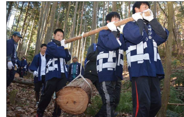
松明木を運ぶ高校生

このような伝統行事を守り継いでいる一ノ井松明講ですが、高齢化が進み、山からの切り出しなどの大変な作業が困難になってきました。そこで今では、地元赤目地区の青年会、名張青年会議所や市民グループの「春を呼ぶ会」、市内の高校生や高等専門学校生たちも加わって、この伝統行事を支えています。そして、その取り組みが、伝統行事を支えていく未来の担い手育成事業として、2011(平成23)年、日本ユネスコ協会連盟の「プロジェクト未来遺産」に三重県で初めて登録されました。