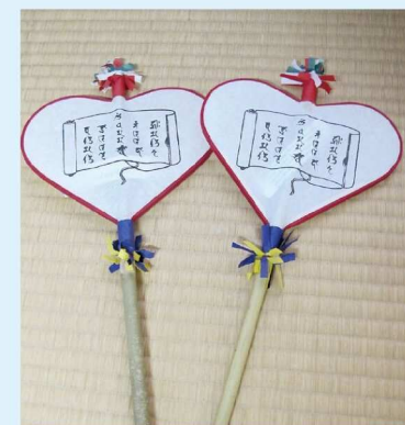
ハート型のうちわ

この唐招提寺に鎌倉時代、覚盛上人と呼ばれる方がおり、生前、殺生はいけないと蚊も殺さなかったことから、その徳を偲んでせめてうちわで蚊を払えるようにとハート型のうちわが、毎年5月19日に唐招提寺の境内でまかれます。このうちわの軸となる竹は、2011(平成23)年より毎年1月19日に名張から送られています。