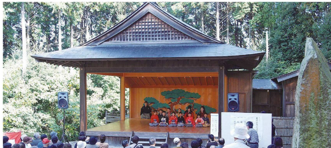
観阿弥祭(観阿弥ふるさと公園)