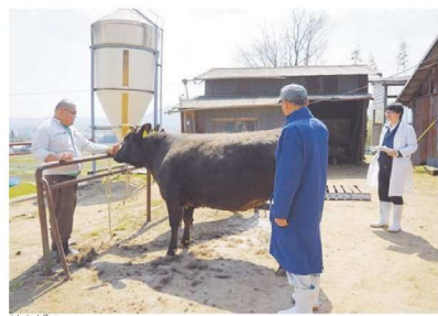
販売業者による牛の見学