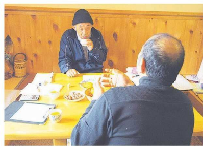
販売業者と生産者の話し合い