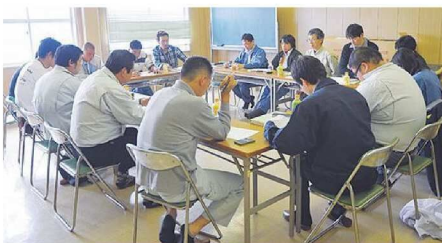
部会での研修会風景

会員の年齢は、20代後半から80代までとさまざまですが、60代の人たちが一番多いです。だんだんと高齢化が進み、あとをつぐ人も減ってきており、牛の飼育頭数も減少してきています。