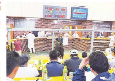
素牛のセリ市への参加