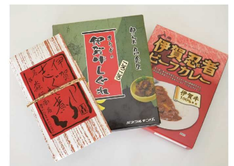
ふるさと納税返礼品

応えんしたい自治体に寄付することができる「ふるさと納税」。名張市へ寄付した人たちに、お礼として名張市の特産品を届けています。その中には「伊賀牛」もあり、全国に向けて発信されています。