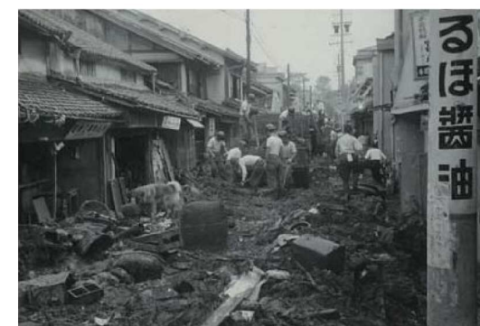
旧町のひ害の様子