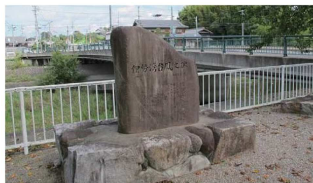
伊勢湾台風のひ (夏見橋付近)

当時わたしは高校生でした。予定されていた体育祭もなくなり、しばらくは学校に行けない日が続きました。屋根までかぶったどろや、よごれて使えなくなった家ざい道具を、自えい隊の車に乗ってかた付けました。ぬれたたたみなどはとても重く、大変な作業が続きました。となり近所はもちろん、おうえんにかけつけたたくさんの人々と助け合い、元の生活を取りもどそうと一生けんめい命でした。