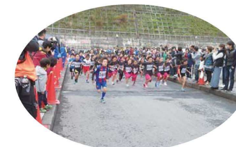
ひなち湖紅葉マラソン大会