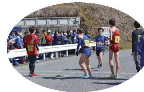
青蓮寺湖駅伝競走大会