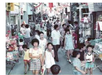
1974（昭和49）年の名張のまちなみ

川の水がきれいな名張には、さげづくりのお店、わがしやさん、木ざいのお店など、さまざまなお店があります。え戸時だいから今もつづいているお店もあります。