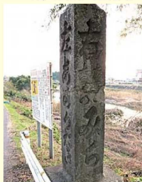
ひだり 左あめがたき（いまの赤目滝のこと） みぎ 右はせならみち