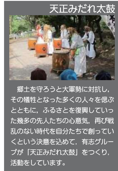
郷土を守ろうと大軍勢に對抗し、その犠牲となった多くの人々を偲ぶとともに、ふるさとを復興していった幾多の先人たちの心意気、再び戦乱のない時代を自分たちで創っていくという決意を込めて、有志グループが「天正みだれ太鼓」をつくり、活動をしています。