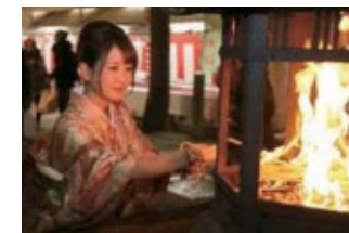
火縄に火をつける様子