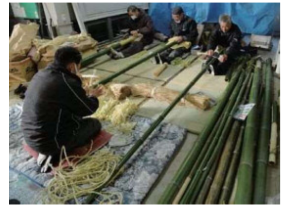
火縄を作る保存会の人たち

現在では、京都市東山区にある八坂神社で、おみそかから元日にかけて行われている「をけら詣り」に、上小波田で生産されている火縄が使われています。青竹で作る火縄は、全国でただ一つとされています。竹でできた火縄は火持ちがよく、薬品を加えなくても、水をかけない限り火が消えることはありません。かつては火縄を作る人が多くいましたが、年々減り続け、一人しかいないとされています。竹でできた火縄は火持ちがよく、薬品を加えなくても、水をかけない限り火が消えることはありません。かつては火縄を作る人が多くいましたが、年々減り続け、一人しかいないとされています。竹でできた火縄は火持ちがよく、薬品を加えなくても、水をかけない限り火が消えることはありません。かつては火縄を作る人が多くいましたが、年々減り続け、一人しかいないとされています。