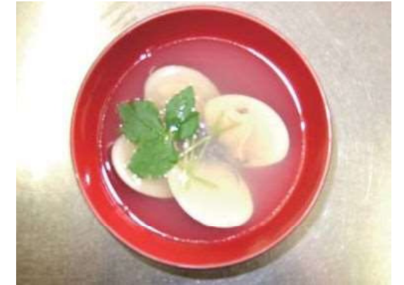
はまぐりのお吸い物

田植えはじめの日に、その年の「作業の安全」と「大豆のように大つぶの米がとれますように」との願いをこめて作り、田の神にお供えました。「さびらきごはん」を熱いうちにふきの葉に包んだものを「ふきだわら」といい、塩味の豆ごはんにふきの香りがほのかに移ります。田植えの時に食べられています。