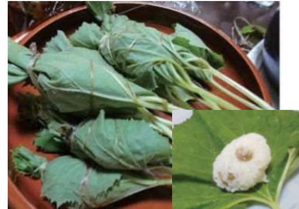
ふきだわら (さびらきごはん)

田植えはじめの日に、その年の「作業の安全」と「大豆のように大つぶの米がとれますように」との願いをこめて作り、田の神にお供えました。「さびらきごはん」を熱いうちにふきの葉に包んだものを「ふきだわら」といい、塩味の豆ごはんにふきの香りがほのかに移ります。田植えの時に食べられています。