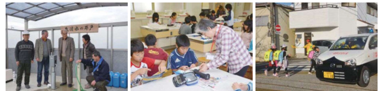
蔵清水の井戸 (蔵持市民センター横)