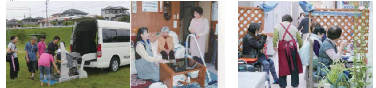
ライフサポートクラブ（すずらん台）