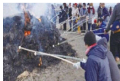
どんどでもちやきをする人たち

このおもちを家に持ち帰り、あずきがゆにに入れて 食べると、一年中かぜをひかないといわれています。 また、じん社や寺のおふだやお正月のまつか ざり、書きぞめをしたしゅう字の紙をもやしてい