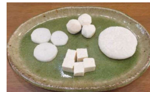
ぞうにのざいりょう