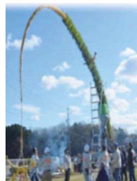
立ち上がるどんど

つぎの日の朝、地元の人が大きな声で家いえの方にむ かって「もやすぞー」「もやすぞー。」と、さけびまし た。そして、どんどは大人に見まもられた子どもたちの 手によって火がつけられ、大きな火となり、バチバチと 音をたてながら、上の方にもえあがっていきました。つ ないであったロープが引かれ、どんどは火がついたま ま、ドーンと音をたててたおれました。すごいはく力で