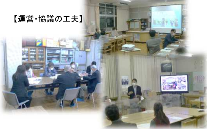
【運営・協議の工夫】

熟議で共有したビジョンや目標の体制に向けて、力を合わせて「子どもたちのため」に取り組めます。熟議で出た意見は、すぐに全てが実行できるわけではありませんが「できることから協働を始める」ことで、徐々に多くの人が関わる協働体制が構築されていきます。