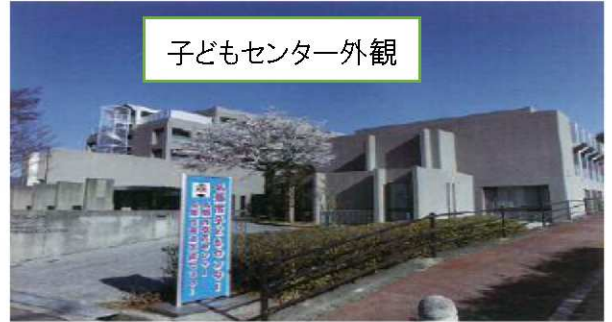
子どもセンター外観

国道 165 号線から百合が丘住宅団地に向かい、最初の信号を右折します。名張市立病院前を通過し、「子どもセンター」の看板のある交差点を右折してください。坂道途中の右手にある建物です。