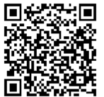
マイ保育ステーション

「保育無料体験利用申請書」を希望日の3日前までに、登録したマイ保育ステーションに提出してください。無料で利用できるのは登録年度中（2月末日まで）1回だけです。