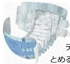
テープでとめるタイプ