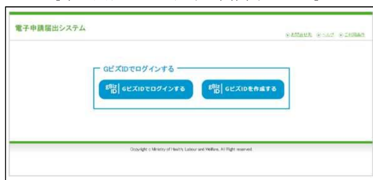
【本システムのログイン画面イメージ】

本システムでご利用できるGビズIDのアカウント種類は、「gBiz IDプライム」と「gBiz IDメンバー」のみになります。