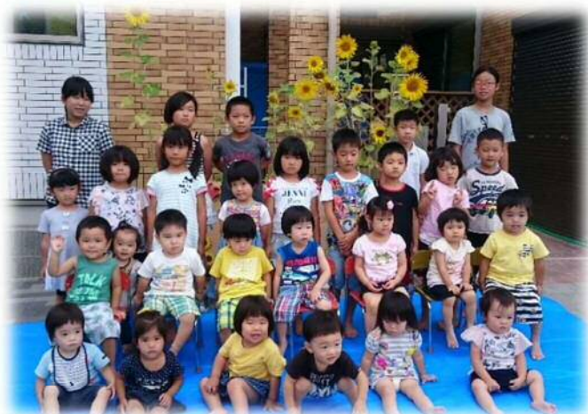
ひまわりとお兄ちゃん・お姉ちゃんと 記念写真