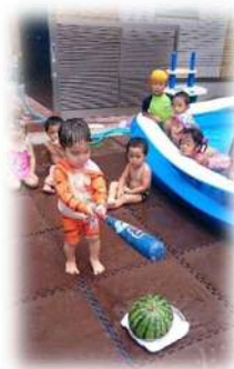
夏の恒例行事 流しそうめん スイカ割り