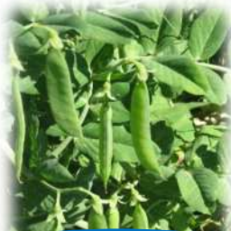
スナップエンドウ

昨年度より、赤目保育所の園庭の一角に設けた「おひさまばたけ」。昨年は、カブとニンジンの種まきと収穫を、今年は、5月にスナップエンドウの収穫を親子でしました。