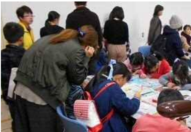
ぱりっ子モールのようす