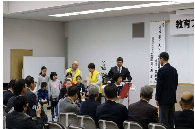
提言書提出のようす