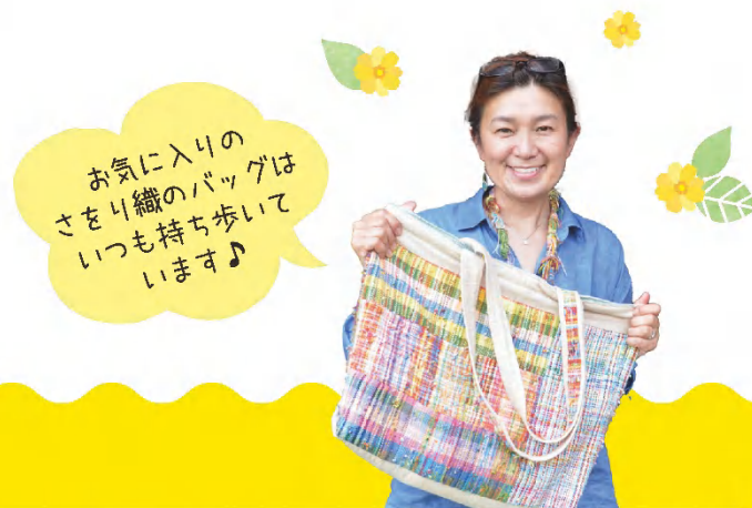
お気に入りのさをり織のバッグはいつも持ち歩いています♪

最終的に私が目指すのは、障がいの有無や世代を超えた自由なコミュニティです。私を受け入れ育ててくれた名張という地域にも貢献していきたい。今、私の目の前にはワクワクする未来が広がっています。