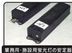
業務用・施設用蛍光灯の安定器