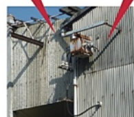
高圧コンデンサー