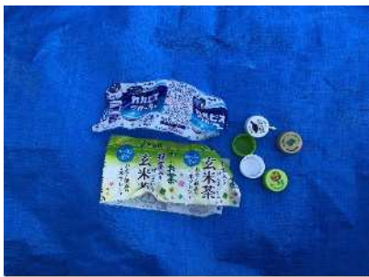
Làm bằng nhựa nhẵn và nắp chai