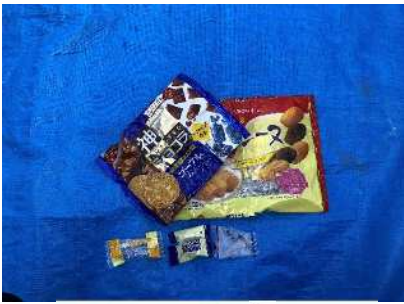
Vỏ túi kẹo