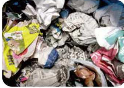
Giấy phế liệu