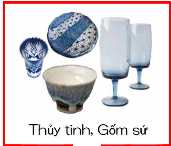
Thủy tinh, Gốm sứ