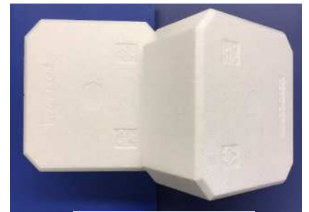
โฟมสไตรอล