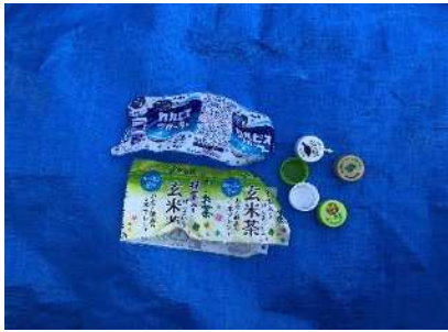
ฝาและฉลวดของขวดทำจากพลาสติก