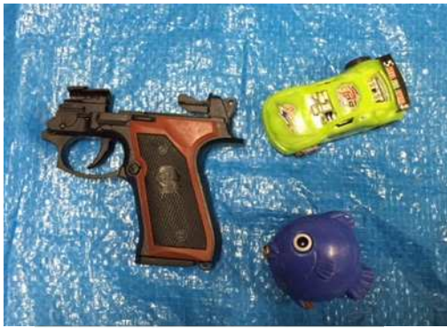
ของเล่น (ไม่ใช่ไฟฟ้า)