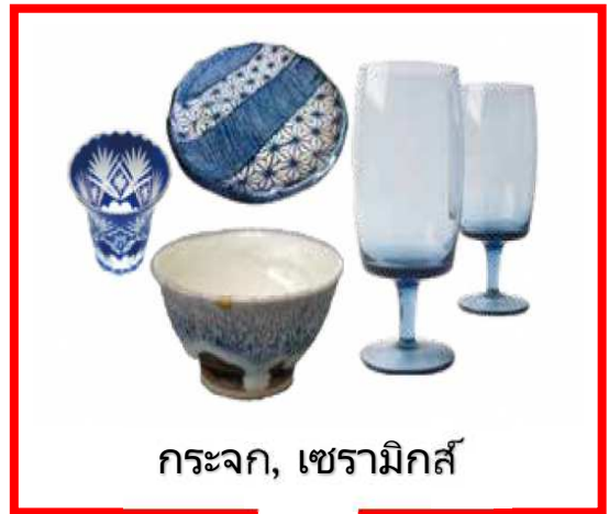
กระจก, เซรามิกส์