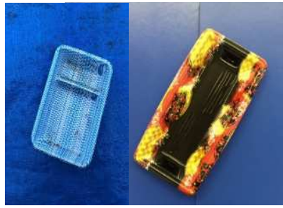
ถาดอาหาร