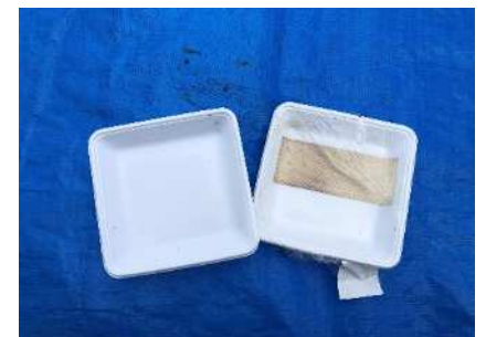
Bandejas blancas plásticas

※ Usar las bolsas de basura designadas por la ciudad de Nabari