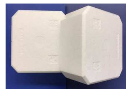
Contenedores sucios de poliestireno