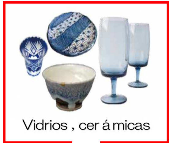
Vidrios , cer á micas