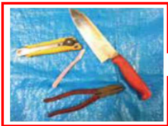
Cuchillos , tijeras

※ Deber á n ser envueltos con peri ó dico o publicidad en el peri ó dico y poner la indicaci ó n de “Kiken” (material peligroso) en la bolsa.