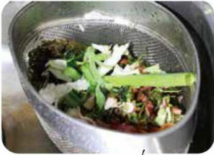
Los desperdicios de comida en casa