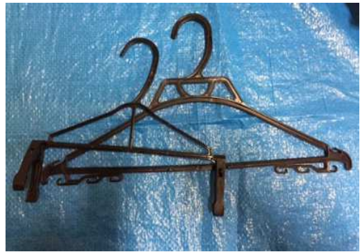
Colgadores pl á sticas