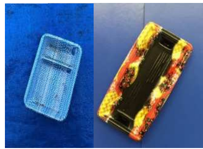
Bandejas plásticas para alimentos