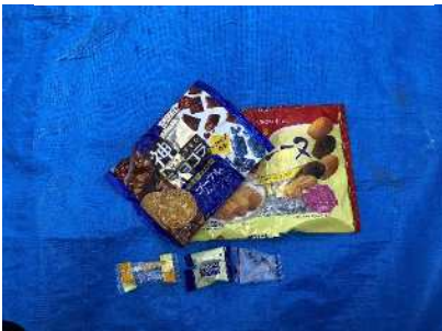
Bolsas plásticas para dulces