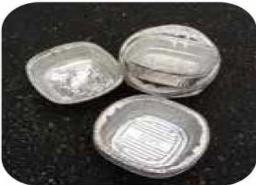
Bandejas de aluminio