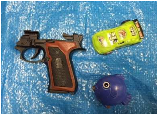
Juguetes (no el é ctricos)