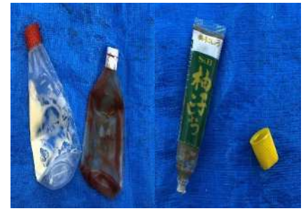
Botellas de sazonadores