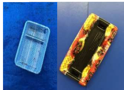
Bandeja de comida