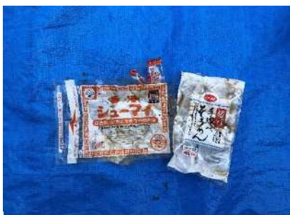
A sacola que continha a comida