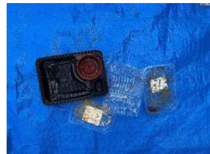
Recipientes de bento e acompanhamento