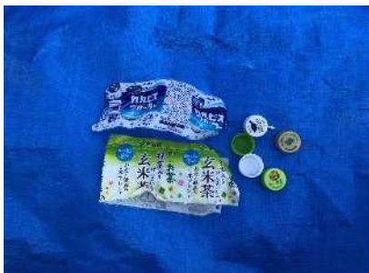
Tampas e r ó tulos pl á sticos