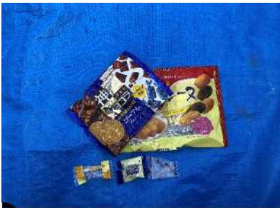
Isang supot ng matamis