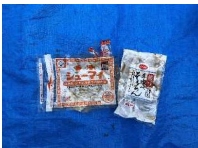
Isang supot na may pagkain sinabi