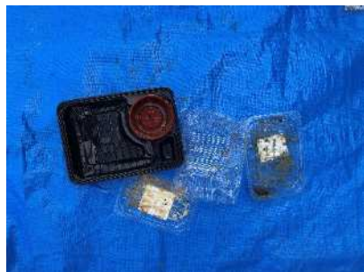
Isang lalagyan ng mga kahon ng bento at gilid plato