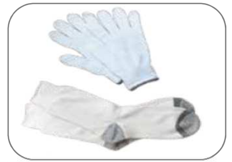
Mga scrap ng iskrin