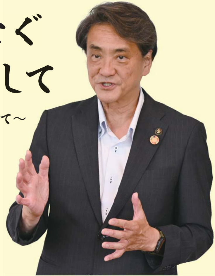
名張市長 北川 裕之