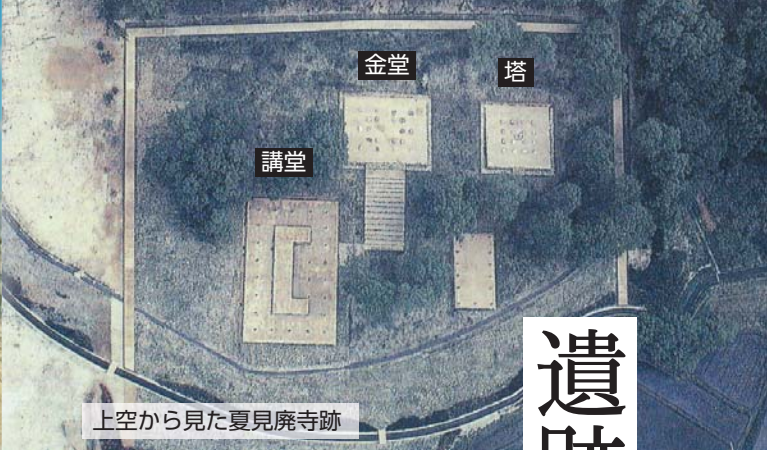
上空から見た夏見廃寺跡