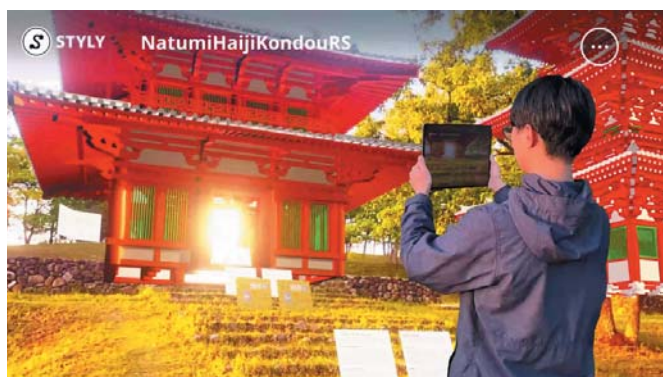
夏見廃寺「AR」（上写真イメージ）の楽しみ方

「地元愛がある人が増えるほど、その地域は豊かになっていくのだと思います。だから、「地