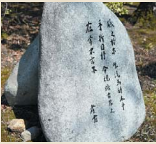
天津皇子を偲んで詠んだといわれる大来皇女の歌碑が廃寺跡に

壬申の乱の後、大来皇女が斎王として伊勢神宮に遣わされたのは、13歳という若さでした。その後、父・天武天皇が崩御すると、弟の天津皇子は後ろ盾を失い、謀反の罪で処刑されます。24歳の頃でした。斎王の任が解かれた大来皇女は都に戻りますが、その後の消息は分かりません。政争に明け暮れ、悲劇を多く生んだ飛鳥から遠く離れ、畿内と伊勢を結ぶこの名張の地は、大来皇女にとって父や最愛の弟の冥福を祈るのに、最もふさわしい場所であったのかもしれませんが。