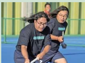
双子みたいに激似！と話題になった奇跡の一枚