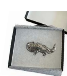
オオサンショウウオ型のブローチ

オオサンショウウオの保護・調査、交雑種などの中国原産オオサンショウウオの隔離施設を整備するための資金を募ります。ご協力いただいた人には金額によって、オオサンショウウオに関連したウクレレやブローチ、クッキーなどをお届け!ご協力をお願いします。