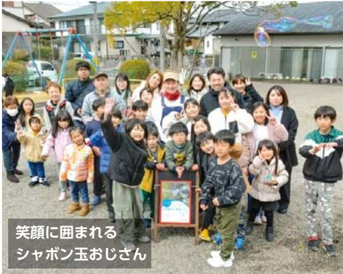
笑顔に囲まれる シャボン玉おじさん