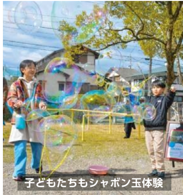
子どもたちもシャボン玉体験