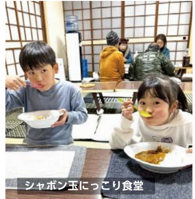
シャボン玉にっこり食堂