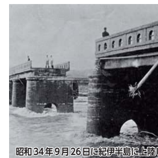
昭和34年9月26日に紀伊半島に上陸した「伊勢湾台風」。新町橋や鍛冶町橋など主な橋が流出。記録に残る名張の大災害となった。