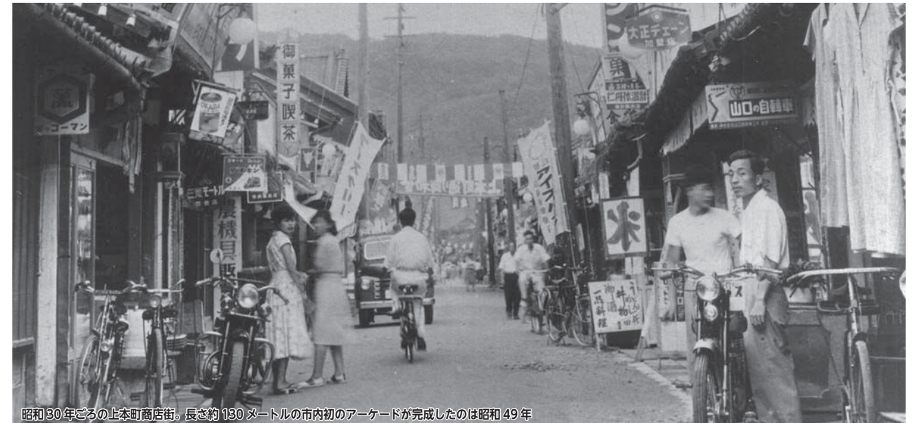
昭和30年ごろの上本町商店街。長さ約130メートルの市内初のアーケードが完成したのは昭和49年