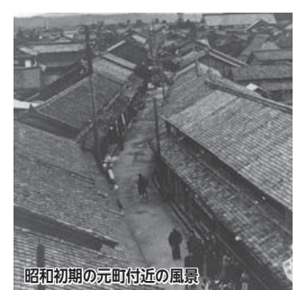
昭和初期の元町付近の風景