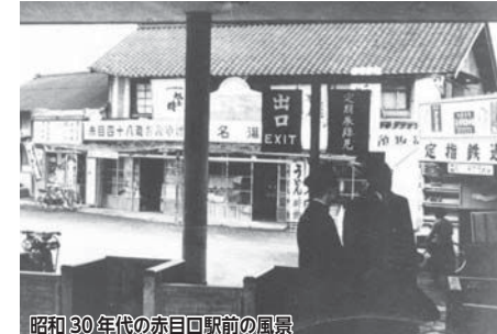
昭和30年代の赤目口駅前風景