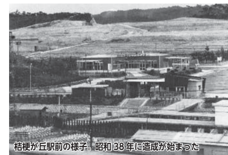
桔梗が丘駅前の様子。昭和38年に造成が始まった