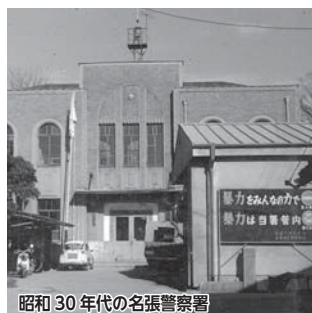
昭和30年代の名張警察署