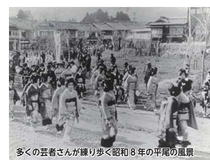
多くの芸者が練り歩く昭和8年の平尾の風景