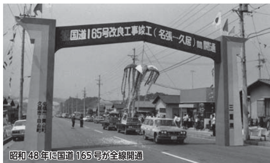
昭和48年に国道165号が全線開通