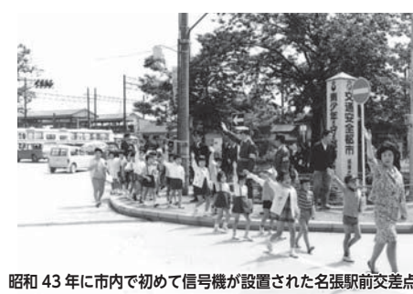
昭和43年に市内で初めて信号機が設置された名張駅前交差点