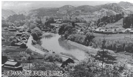
国道165号が通る前の夏見付近