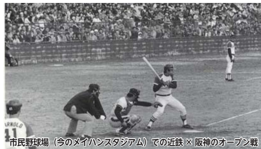
市民野球場 (今のメイハンスタジアム) での近鉄×阪神のオープン戦