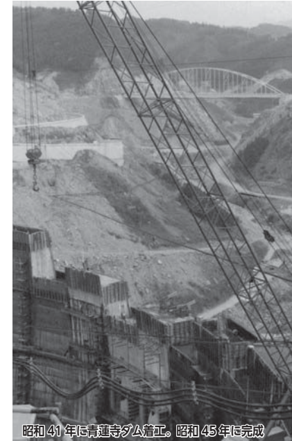
昭和41年に青蓮寺ダム着工。昭和45年に完成