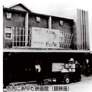
市内にあった映画館 (銀映産)