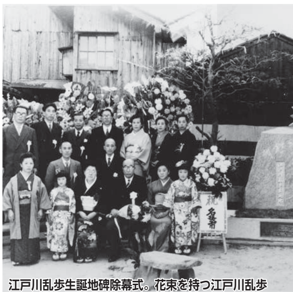
江戸川乱歩生誕地碑除幕式。花束を持つ江戸川乱歩