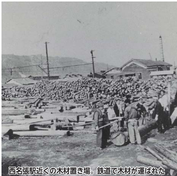
西名張駅近くの木材置き場。鉄道で木材が運ばれた