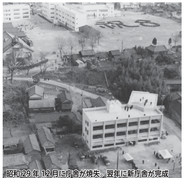
昭和29年12月に庁舎が焼失。翌年に新庁舎が完成

モノクロ・タブロイド版でお届けしてきた「広報なばり」は、来月4月号から、A4サイズのカラー紙に生まれ変わり、市民の皆さんの元へお届けします。令和6年3月で市制施行70周年を迎えた名張市とともに、新たな歩みを踏み出す「広報なばり」を末永くご愛読ください。