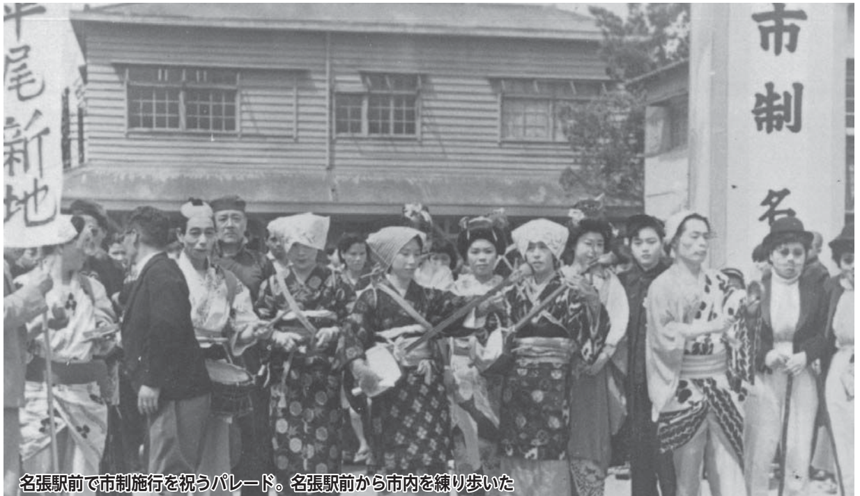
名張駅前での市制施行を祝うパレード。名張駅前から市内を練り歩いた