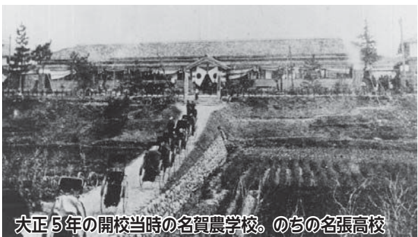
大正5年の開校当時の名賀農学校。のちの名張高校