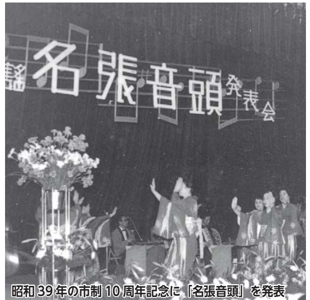
昭和39年の市制10周年記念に「名張音頭」を発表