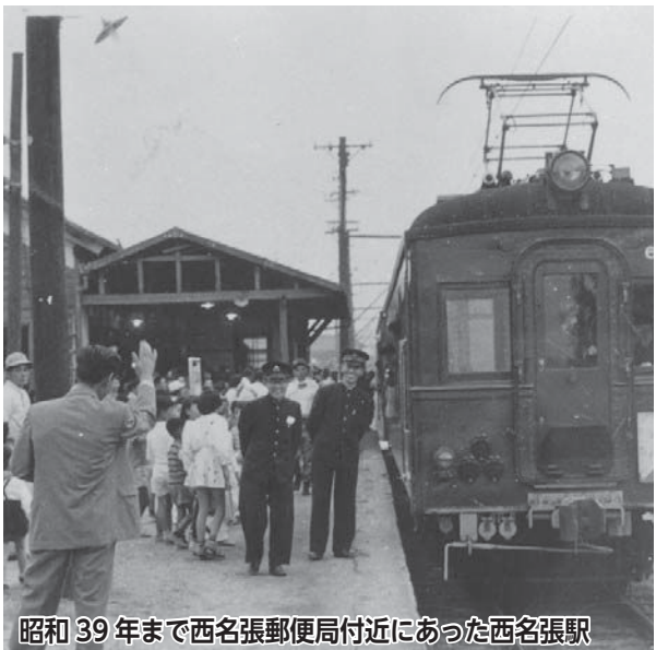
昭和39年まで西名張郵便局付近にあった西名張駅