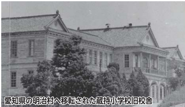
愛知県の明治村へ移転された蔵持小学校旧校舎

発行/名張市 広報シティプロモーション推進室 〒518-0492 名張市鴻之台1-1 ☎0595-63-7402 FAX 0595-64-2560 ✉pr@city.nabari.lg.jp