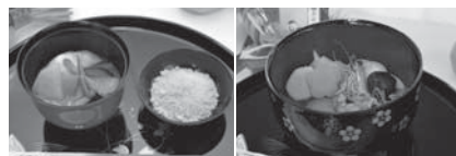
▲のっぺ風きな粉雑煮

各家庭でカタチの違うお雑煮。「あなたの家はどんなお雑煮？」周りの人に聞いてみたら、驚きの答えが返ってくるかも!?