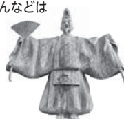
市役所にある観阿弥像