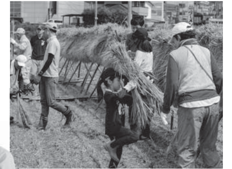
稲刈りイベントでの「はさがけ」作業の様子