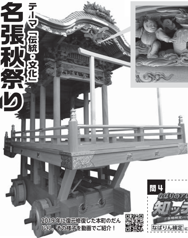
2019年に復元修復した本町のだんじり。その様子を動画でご紹介!