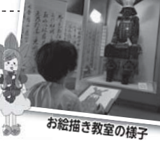
お絵描き教室の様子

名張藤堂家邸をより身近に感じてもらうと、お絵描き教室やプロジェクションマッピングなどが行われているんだ。次の中で、実際に行われたことがあるものはどれ?