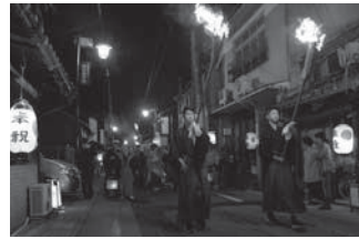
侍の格好で宇流富志禰神社へ練り歩く様子

「名張秋祭り」は、「宇流富志禰神社」の秋祭りで、約400年前にこの地を納める藤堂家から年に一度の祭りの時だけ民衆も侍の格好をすることが許され、祝いの松明行列をするようになりました。