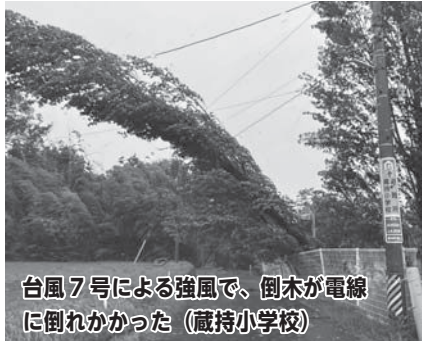
台風7号による強風で、倒木が電線に倒れかかった(蔵持小学校)