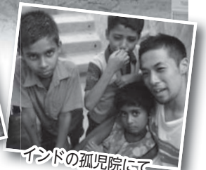
インドの孤児院にて