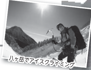
八ヶ岳でアイスクライミング

世界中を旅してきた私。「登山ガイドをしよう」と資格を取って、いよいよというときに、新型コロナでツアーは次々と中止に…。そんなとき、「エコツアーリズム」をテーマに、名張市が地域おこし協力隊を募集していることを知りました。