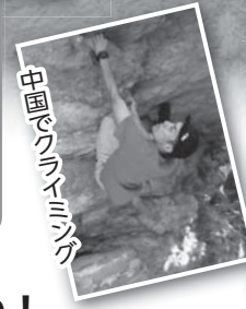
中国でクライミング