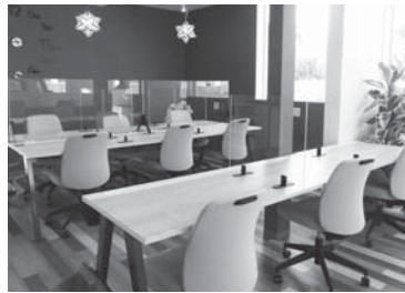
☎ コワーキングスペース SHINYU (シンユウ)

共有利用型オフィス（コワーキングスペース）として、コピー機やWi-Fiなどを備えていて、テレワークをはじめ、会議や自習など、さまざまな利用ができますので、ぜひご活用ください。