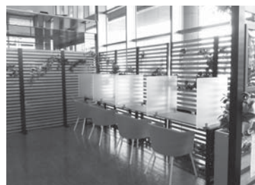
☎ コワーキングスペース アスピア