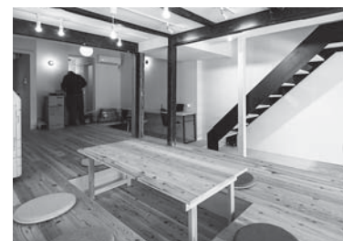
☎ FLAT BASE (フラットベース)