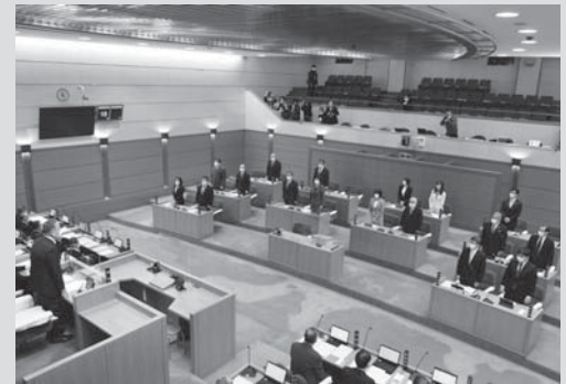
「名張市議会の解散決議案」についての採決時の様子(3月10日/市議会本会議場)

市議会の解散により、市議会議員選挙は、4月17日の市長選挙と同時に開催されることとなりました。