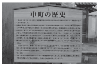
道標の隣には、「中町の歴史」が書かれた看板が建てられています