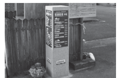
4基目となる中町に建てられた道標

皆さん、初瀬街道の歴史を感じながら、道標を頼りに名張のまちなかを散策してみたいはいかがでしょうか。