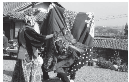
村まわしでの舞(黒田)

基本的に、獅子舞は二人一組で太鼓の音に合わせて舞います。また、舞手の好みににより微妙に変化を加えるというところもあるため、代を重ねるごとに変化していくという現象が生じたためです。現在は、コロナ禍のため、祭事も一部中止・縮小を余儀なくされ、獅子舞を奉納する機会も減りましたが、早くコロナ禍が収まり従来のように祭事が行われることを切に願っています。