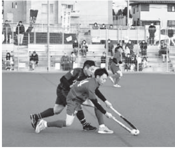
はなの里スタジアム(市民ホッケー場)

今後の施設整備は、三重県ホッケー協会との意見交換も踏まえ、更衣スペースなど必要な施設整備の支援を県へお願いする。また、競技人口の増加や競技力向上に向けて、ホッケースポーツ少年団の創設支援などジュニア世代を育成することや、はなの里スタジアム(市民ホッケー場)の活用を通して、市内におけるクラブチームの創設へと繋げていきたい。引き続きホッケー協会との連携を継続し、「ホッケーのまちなばり」の推進、定着に向けて取り組む。