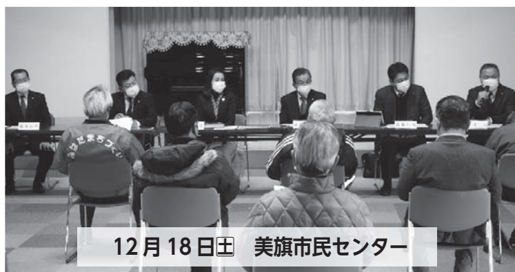
12月18日(土) 美旗市民センター