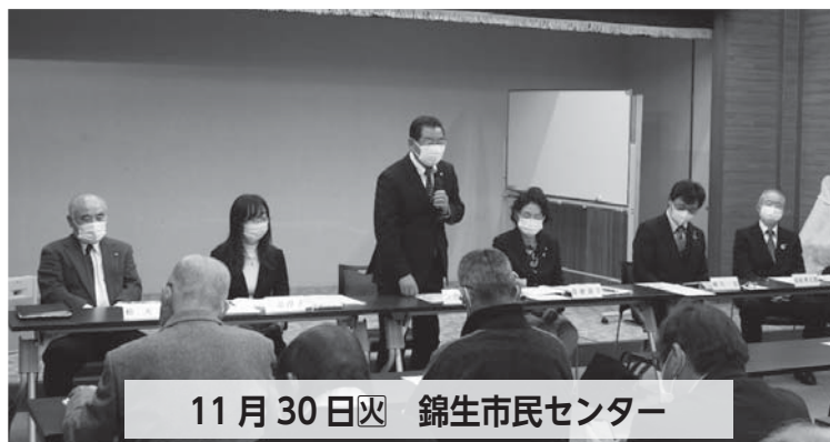
11月30日(火) 錦生市民センター