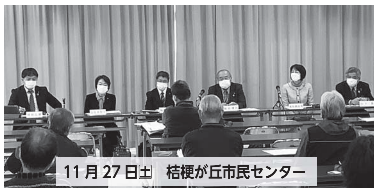
11月27日(土) 桔梗が丘市民センター