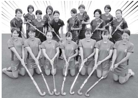
写真は女子チームの皆さん