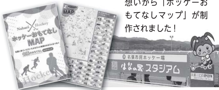
制作:MPJ ホッケーおもてなしマップ制作プロジェクト

「ホッケーをきっかけに、名張観光のリピーターになってほしい」と地域の皆さんの想いから「ホッケーおもてなしマップ」が制作されました!