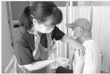
5/31 ~ 市立病院