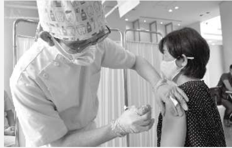
研修を経て、歯科医師には接種を、薬剤師には薬液充填を担っていただいています