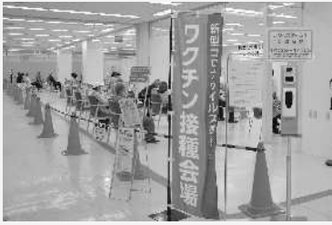
5/31 ~ イオン名張店リバーナ