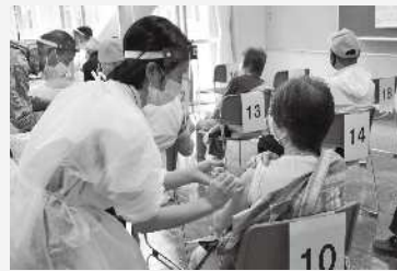
6/5 ~ 旧桔梗が丘中学校

高齢者対象の新型コロナワクチン接種について、かかりつけ医による個別接種は5月24日から開始。集団接種は、5月31日以降、市内3会場で順次始まっており、6月14日現在、重篤な副反応の報告はありません。今後も、接種を希望する全ての人が接種できるように取り組んでいきます。