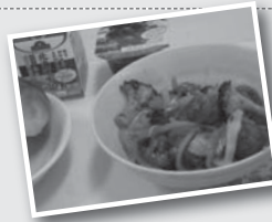
名張の新名物を提案 ▶ 「かたやきソフト」(H30)

「名張市子ども条例」制定から15年。子どもの「参加する権利」を保障する「ばりっ子会議」は、子どもたちが自ら開催し、子どもたちの「思い」を発信しています。