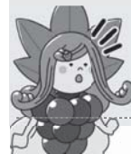
◀ 子どもたちの考えた名張の魅力を詰め込んだ「なばりん」。小学生が考えたデザインを大学生が仕上げたんだって!(R1)