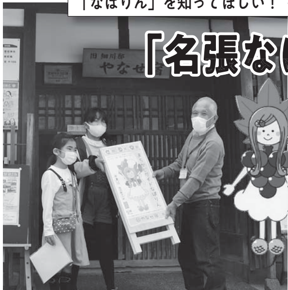
4月3日、市内6カ所で引き渡し式が行われました