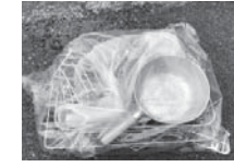
小型家電ではない（金属類など）