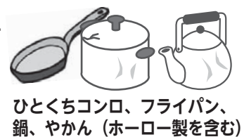
ひとくちコンロ、フライパン、鍋、やかん（ホーロー製を含む）