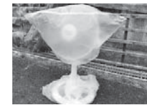
複数の袋に入れている