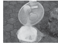
袋からはみ出ている