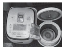
袋に入っていない