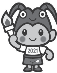
三重とこわか国体・三重とこわか大会 公式マスコットキャラクターとこまる

コロナ禍の中、市民皆さんの総力を結集いただき、全国から訪れる選手や関係者へのおもてなしの一環として、小・中学生の心がこもったメッセージが入ったのぼり旗の作製を依頼している。今後、広報紙やホームページなどを活用し、本市で開催される競技を知ってもらい、市民全員が応援団となり、全ての来訪者を温かく歓迎・応援していただけるよう取り組む。