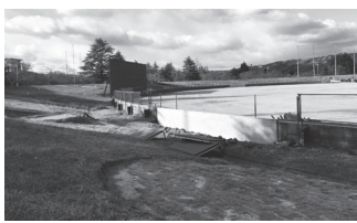
改修が始まったメイハンスタジアム

思い切った施設整備への投資は将来にわたり市民の健康を守るだけでなく、若者の移住・定住にも繋がりが、人口減少の歯止めにもなる。しかし、中途半端な投資では将来の本市のためにはならない。国体に向けての現在の施設整備の状況はどうか。また、正式競技の会場となっている野球場は整備が遅れている状態であるが、今後の展望を問う。