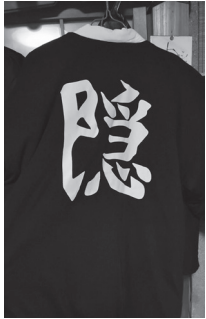
「鬼滅の刃」救護班の衣装

コロナ禍の中、アニメ「鬼滅の刃」のグッズや関連観光地は大人気を博している。作中に登場する救護班の衣装の背中に大きく「隠」と書いてあるが、本市においても観光協会が制作しているポロシャツにこの文字を使用しているものもある。この機会に救急救命士の服装に、「隠」を用いて本市のアピールをすべきだ。